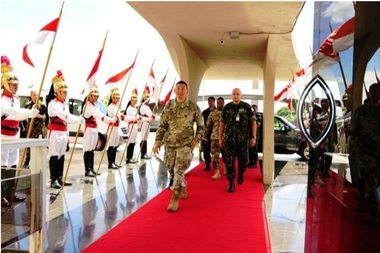
En visita a Brasil, el General de División Clarence K.K. Chinn (en frente), comandante del Ejército Sur de los EE. UU., demostró intenciones de ampliar las relaciones de cooperación militar.

Según el CCOMSEx, en los próximos años habrá una preparación especial para la Operación Culminating , como la capacitación de los oficiales y sargentos observadores, los controladores y evaluadores (OCA, por sus siglas en portugués) y el entrenamiento específico de la tropa. En septiembre militares brasileños irán a Fort Polk para la cuarta Reunión de Coordinación en el JRTC. El objetivo es entender el proceso de evaluación y los desafíos logísticos y de preparación de la Operación Culminating .